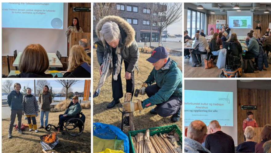
Bildene er tatt fra årsmøtet