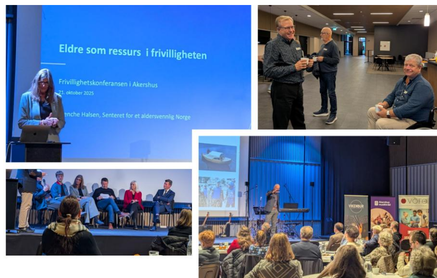
Bildene er tatt fra Akershus Frivillighetskonferanse

Vofo var for første gang medarrangør av Frivillighetskonferansen i Akershus, som ble holdt 23. oktober på Folkets Hus i Lillestrøm. Dette er et samarbeid forankret i partnerskapsavtalen mellom fem paraplyorganisasjoner og Akershus fylkeskommune. Årets tema satte søkelys på demokrati og demografi sett fra et frivillighetsperspektiv.